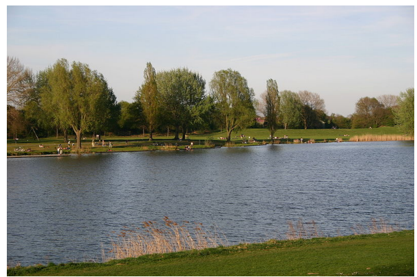
Blick von der Neustadt auf das Gewässer

Bei dem Weserhochwasser von März 1981 bewährte sich die Flutrinne nicht. Die aus der Mittelweser einströmenden Wassermassen nahmen überwiegend einen anderen Weg, strömten schon an der Werderbrücke (heute Karl-Carstens-Brücke) in die Unterweser und gruben sich dabei ein tiefes neues Bett.