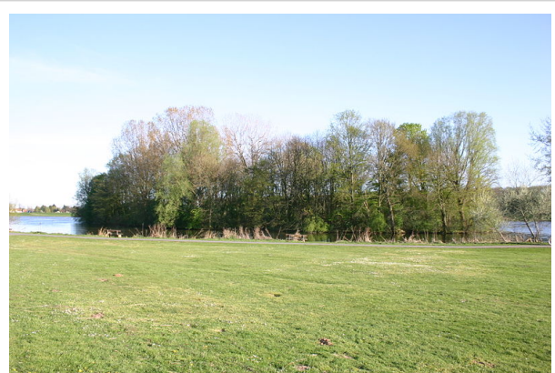
Blick vom Nordufer auf die Vogelinsel